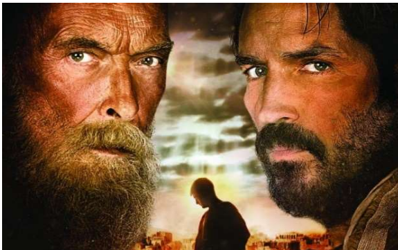
Foto: iz filma Paul Apostel of Christ

Na kraju ovog razmišljanja zaključimo: Isus uvijek poziva, nekad i sad. I tebe danas pita: što tražiš? Bez obzira jesi li Matej ili Zakej, preljubnica ili teški grješnik... dođi da vidiš gdje Isus stanuje i osjetiti ćeš snagu susreta s Isusom. Samo u susretu s njim možeš se mijenjati. Ne boj se promjene na bolje! Pavao se potpuno promijenio: od progonitelja postao je propovjednik Radosne vijesti (Dj 9,1-19).