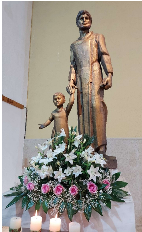
Sv. Josip, Karlovac

predodređenje, predviđanje prije poziva i opravdanja, što bi značilo Božje predznanje prije izbora. Isus naznačuje koji su njegovi pravo pozvani učenici (Mt 7,23). Dakle, On zna za pravo pozvane i krivo pozvane. On pozna svece i srebroljupce. Bog poznaje one koji ga stvarno i iskreno ljube (1 Kor 8,3) i koji su njegovi (2 Tim 2,19). U poslanici Efežanima Pavao konstatira da izabrane Bog u Kristu sebi izabra prije postanka svijeta, da budu bez mane, te ih u ljubavi „predodredi za posinstvo, za sebe po Isusu Kristu, dobrohotnošću svoje volje, na hvalu svoje milosti“ (Ef 1,3-6). Malo dalje u istoj poslanici spominje da „u Njemu, u kome i nama predodređenima po naumu Onoga, koji sve izvodi po odluci svoje volje, u dio pade“ (Ef 1,11), da budemo na hvalu slave njegove! Bog je sveznajući, ali poštuje slobodu čovjeka pri njegovu izboru.